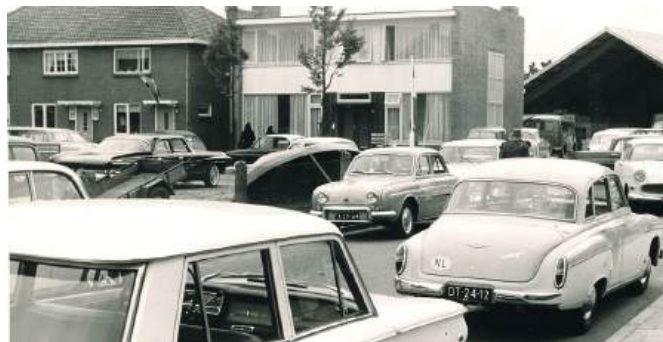
Opening woning met loods Heiweg

Daar werd een enorme loods gebouwd. De achterste helft werd dubbel geïsoleerd en bestemd voor de opslag van de vele soorten aardappelen. Het voorste deel werd opslag voor alle soorten kolen als antraciet, cokes, eierkolen, briketten en later ook voor de gasflessen. Vooral voor de vele studenten, die een kamer met gaskachel bewoonden, was dit een uitkomst. De vele schepen, die dagelijks over de Waal voeren, betrokken ook gascilinders van Van Stijn. Iemand van de bemanning gaf bijtijds de bestelling door en als het schip arriveerde, werden de lege en volle cilinders op de kade omgewisseld.