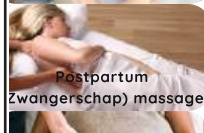
Postpartum (Zwangerschap) massage