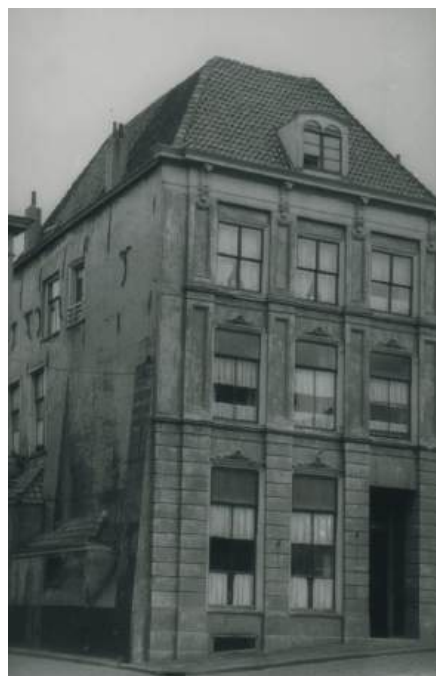
Grotestraat 72-74