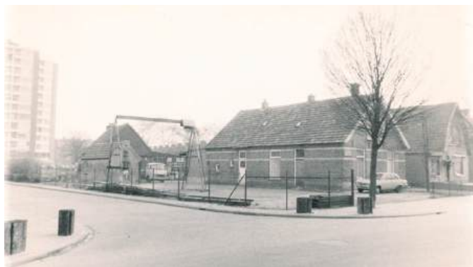
Smederij Van de Water